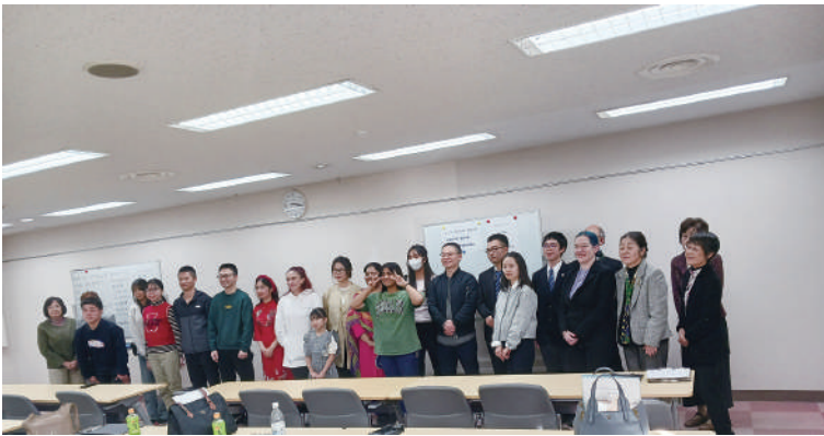
レッツ エンジョイ スピーチ

2026年3月24日 発行 市原市国際交流協会 〒290-8501 市原市国分寺台中央1-1-1 市原市役所 スポーツ・文化振興課 TEL 0436-23-9866 FAX 0436-21-0332 e-mail: iia@city.ichihara.lg.jp ホームページアドレス https://iia-ichihara.org/