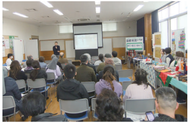
国際交流ひろば 来て！見て！話そう！